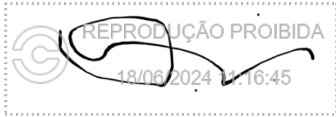
Oswaldo Brison Maia 18 jun 2024, 11-16-46.png

Assinatura manuscrita com hash SHA256 prefixo 1020d7(...)