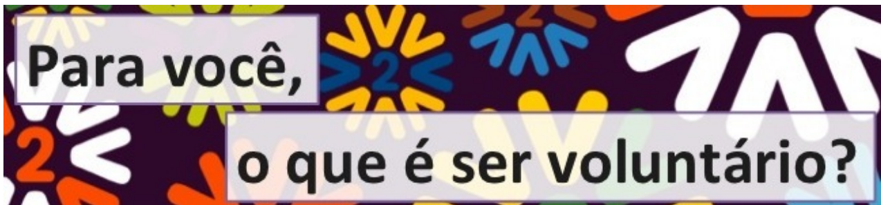
Banner da campanha

Portal do Voluntário e a campanha Para você o que é ser voluntário?