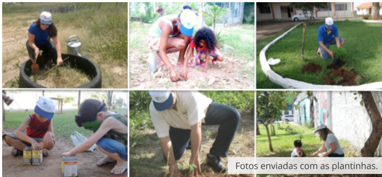
Fotos enviadas com as plantinhas.