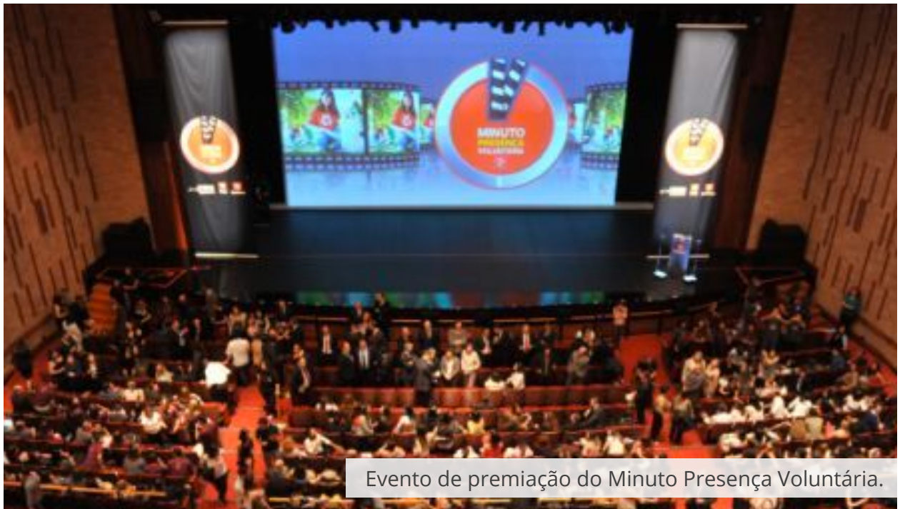
Evento de premiação do Minuto Presença Voluntária.