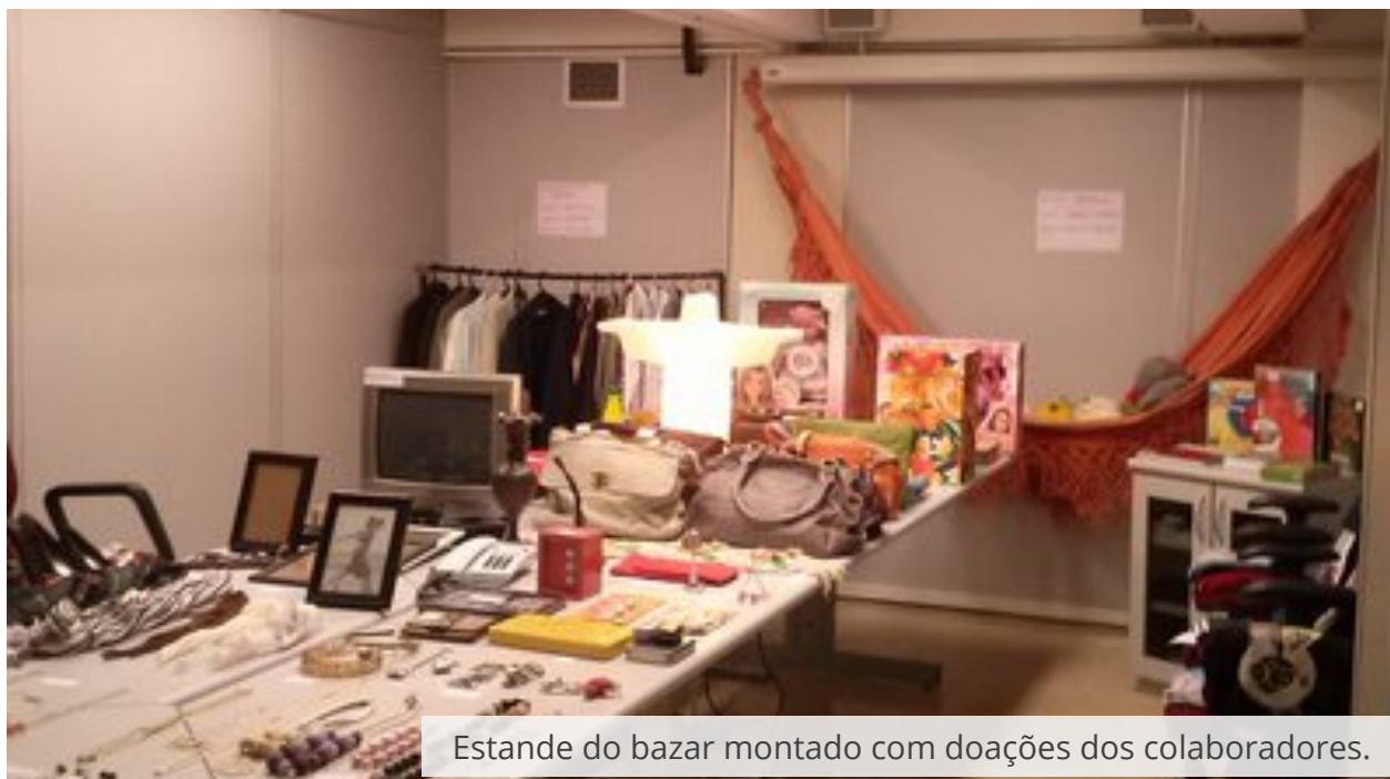
Estande do bazar montado com doações dos colaboradores.