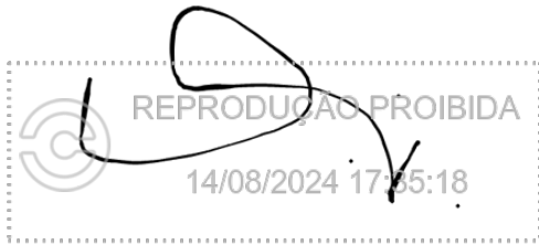
Oswaldo Brison Maia 14 ago 2024, 17-35-18.png

Assinatura manuscrita com hash SHA256 prefixo b1a84d(...)