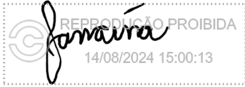
Janaina Faria 14 ago 2024, 15-00-13.png

Assinatura manuscrita com hash SHA256 prefixo cb7eda(...)