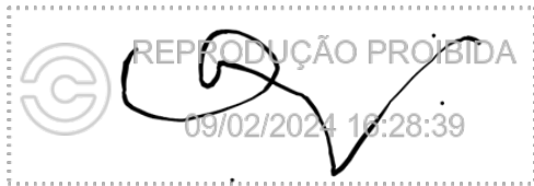
Oswaldo Brison Maia 09 fev 2024, 16-28-39.png

Assinatura manuscrita com hash SHA256 prefixo c88013(...)