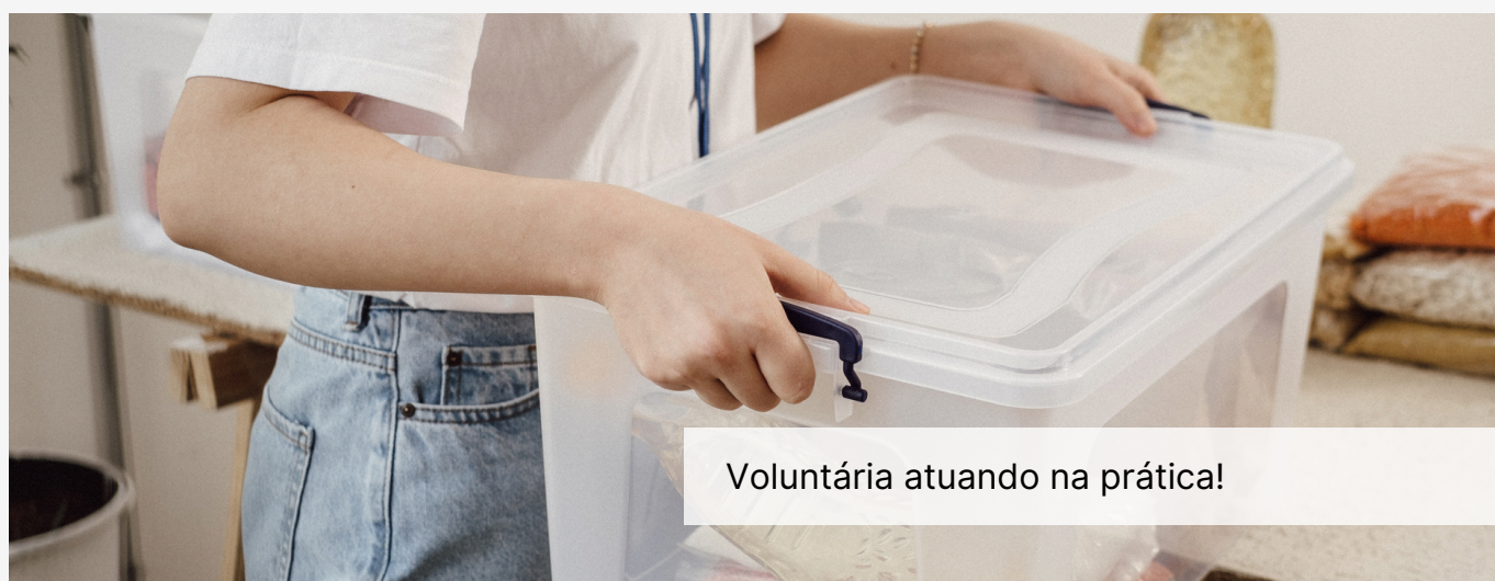
Voluntária atuando na prática!

Você não está sozinho! Conte com o Voluntariado BB durante a sua jornada como voluntário.